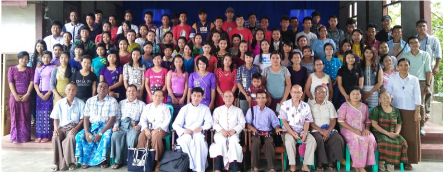
သက်သေခံချက်များမှ ဝိညာဉ်တော်ဘုရား လှုပ်ရှားမှုများကို မျက်မြင်တွေ့မြင် ခဲ့ရပေ သည်။ ညနေ (၄း၀၀)နာရီတွင် လူငယ် အစည်းအဝေးနှင့်ရှေ့လုပ်ငန်းစဉ်များကို ဆွေးနွေးကြပြီး လူငယ်များမိမိ၏သာသနာ အသီးသီးသို့ ပြန်လည်ထွက်ခွာ ခဲ့ကြ သည်။ OSC(PYAY)

ခဲ့ကြသည်။ လူငယ်များ၏တွေ့ဆုံပွဲနှင့် ဂျူ ဘီလီပွဲအထူးအစီအစဉ်ဖြင့်ဘုန်းတော်ကြီး ဗညားနွယ်နှင့်အဖွဲ့မှဦးဆောင်ပြု၍ နံနက် (၁၀း၀၀)နာရီမှ ညနေ (၂း၃၀)နာရီထိ ဒေသနာတော် ဟောကြားခြင်းအစီအစဉ် နှင့် ကုသခြင်းအစီအစဉ်များ ပြုလုပ်ကြ သည်။ ဤဒေသနာဟောကြားခြင်းသည် အချိန်ရှည်လျားသော်လည်း တက်ရောက် နားထောင်ကြသော ဆရာတော်ဘုရား ၊ဘုန်းတော်ကြီးများ သီလရှင်များ လူငယ် များနှင့် ဘာသာတူများအတွက် တစ်ခဏ သဖွယ်ခံစားရသည်။ ဒေသနာဟောကြား ခြင်းအပြီးတွင် တရားနာပရိတ်သတ်တို့၏