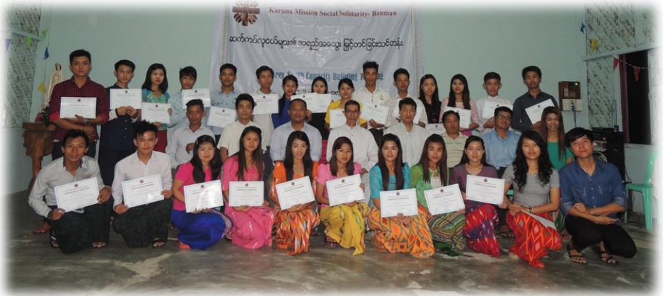
ဆက်ကပ်လူငယ်များ၏.....စာ(၁၄)