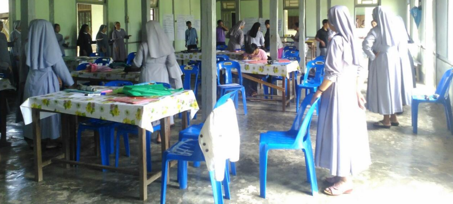
ခွဲခြားဆက်ဆံတတ်သောသဘော စသည်တို့သည် ကလေးများ၏ အခွင့်အရေးနှင့် တိုးတက်မှုကို ထိခိုက်စေနိုင်သောကြောင့် သတိထားရှောင်ကျဉ် ရန် လိုအပ်ကြောင်း ပညာပေးပြောကြားခဲ့သည်။