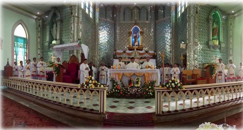
ရဟန်းဝါတော်(၂၅)နှစ်ပြည့်.....စာ(၁၄)